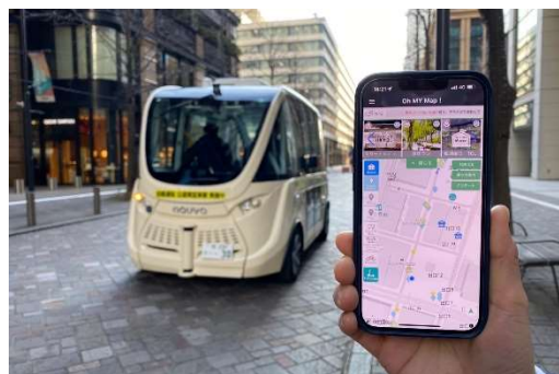
期間中「Oh MY Map!」に実装されるモビリティの運行情報

なお本取り組みは、大丸有協議会を構成員とする大丸有スマートシティ推進コンソーシアムが昨年7月に応募・同8月に採択を受けた2021年度「国土交通省(都市局) /スマートシティモデルプロジェクト(継続採択/3年目) 直轄調査事業」の一環として実施しております。