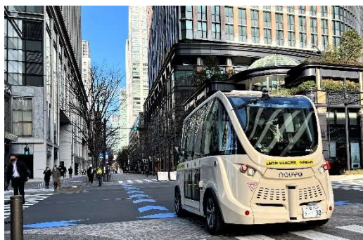
丸の内仲通りを走行する自動運転モビリティの様子（準備走行時）

大丸有協議会と BOLDLY は、2017 年から丸の内仲通りにおいて継続して自動運転バスの実証実験を行うとともに、警視庁を交えて安全対策に関する協議を重ねてきました。その結果、本実証実験では、信号機付き交差点を含む、歩行者専用となる全区間を走行ルートとした運行を実現することができました。今後も、大丸有協議会と BOLDLY は、実証実験を通して得られるさまざまな知見を活用し、スマートシティの実現に向けて新たな挑戦を続けます。